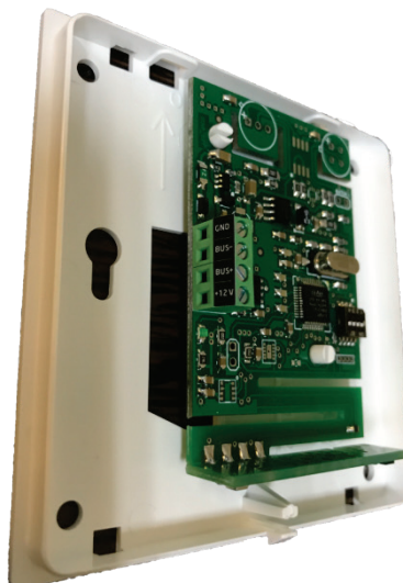
Изображение 3. Назначение контактов разъема.