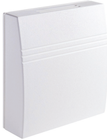
Изображение 1. Внешний вид мультисенсора.

Внешний вид Устройства представлен на Изображении 1.